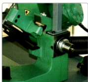
Exzenter für Einstellung der senkrechte Stellung vom Bügel

(*) Spannstockschultern können nach hinten verstellt werden so dass die max. Schnittka- pazität (340 x 180 mm) erreicht wird, Eingek- erbte Mass-Skala mit einfacher Ablesung