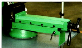
Spannstock mit Schnellannäherung mit einstellbarer Leiste