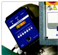
Elektronische Schnittgeschwindigkeitsvariator für Sägeblatt