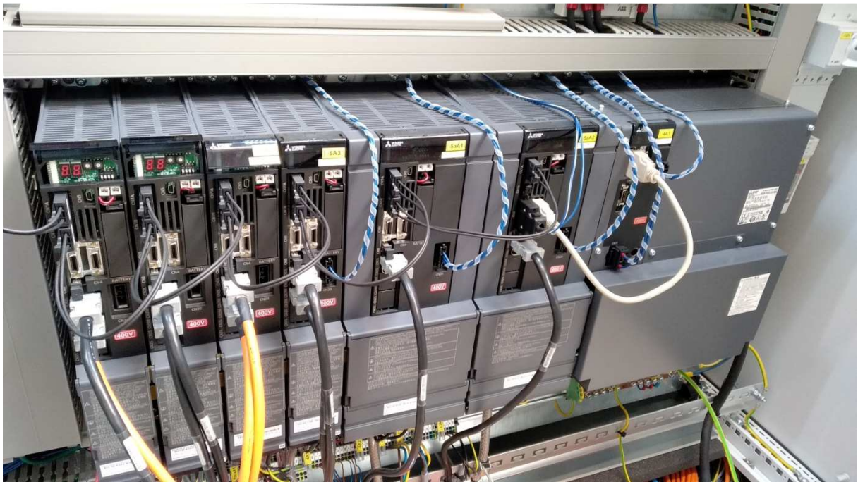
CNC-Steuerung mit Achsantrieben